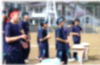
ペットボトルリレー